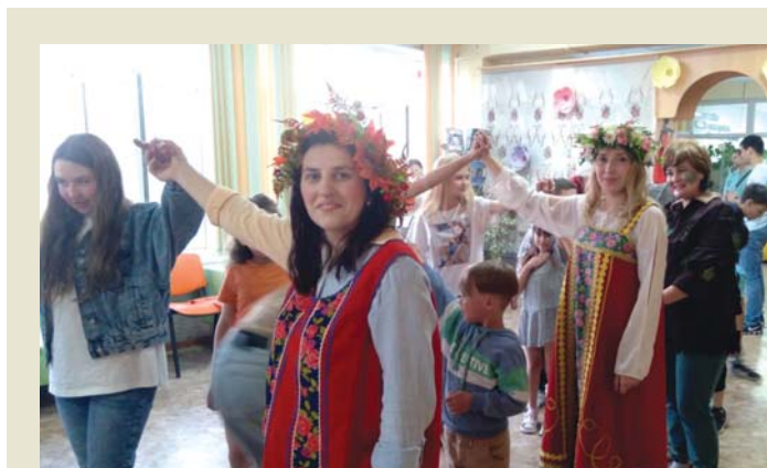
Вспомнили игру «Ручеек»

зыка и песни в исполнении педагогов и учеников Асиновской ДШИ. Под занавес акции подростки попросили устроить им дискотеку под народные песни, которые так раззадорили танцоров, что те задержались на этой площадке после её официального закрытия.