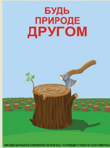
Плакат, Александр МАРЧЕНКО