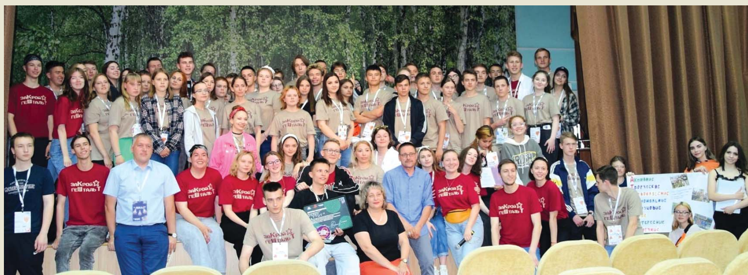
Финальная встреча в «Кадровой школе»

– Моё впечатление о «Кадровой школе» очень положительное. Я являюсь первокурсницей, но уже стала секретарём и руководителем творческого направления «Littlesovet» и для меня было очень много нового, много полезной и интересной информации. Это: безусловно новые знакомства, большой опыт коммуникабельности, заряд энергии и получение новых эмоций. Я считаю, что данное мероприятие мне пошло на пользу и в дальнейшем в моей работе будет прогресс!