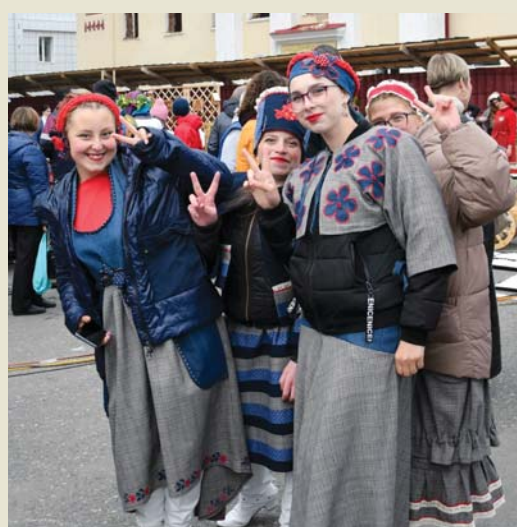
Наряды по сезону к лицу студенткам АТпромИС