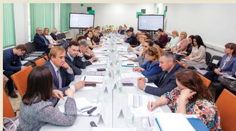
Заседание совета директоров СПО

Ещё на совещании обсуждали реализацию регионального проекта «Патриотическое воспитание граждан Российской Федерации» и увеличение охвата студентов, вовлеченных в мероприятия и проекты патриотической направленности, а также орга-