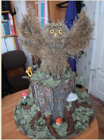
Подделка, Анжелика ЛОБАНОВА